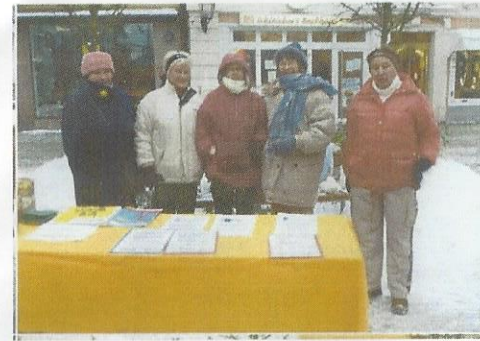
Unterschriften für die Menschenrechte