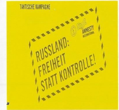
Kritische Beurteilung durch Amnesty International