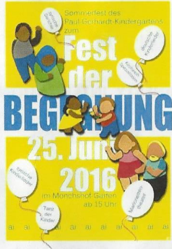
Flüchtlinge und Asylbewerber sind willkommen